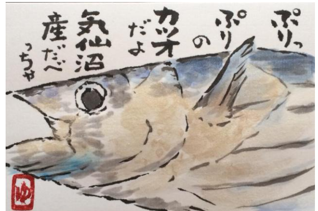
（南瓜・気仙沼の戻り鯉 絵：大坂裕子）

ジョブ・カードだよりに関するご意見やご要望につきましては、下記までご連絡ください。